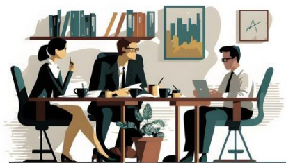
Slika 2. Medijacija kao neformalan postupak